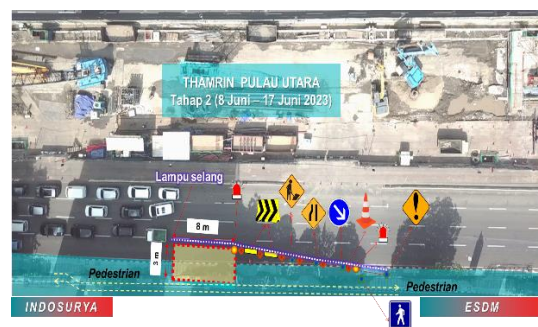
Gambar Ilustrasi Pekerjaan Soil Investigation Entrance 7 Tahap 2; 8 Juni 2023 – 17 Juni 2023