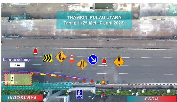
Gambar Ilustrasi Pekerjaan Soil Investigation Entrance 7 Tahap 1; 29 Mei 2023 – 7 Juni 2023