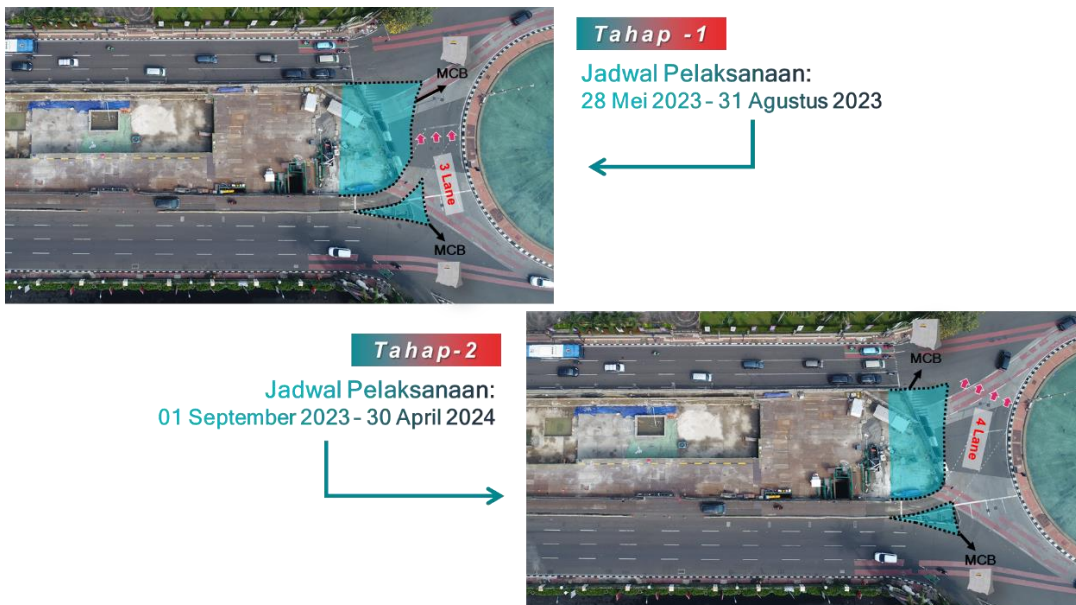
Gambar Ilustrasi Pekerjaan Struktur Tambahan Tunnel Untuk Stabling Area Stasiun Thamrin

PT MRT Jakarta (Perseroda) bersama Shimizu-Adhi Karya Joint Venture (SAJV) selaku kontraktor pelaksana senantiasa memastikan kenyamanan dan keselamatan para pengguna jalan tetap terjaga selama proses konstruksi berlangsung dengan memasang rambu lalu lintas, marka jalan dan lampu penerangan jalan umum (PJU).