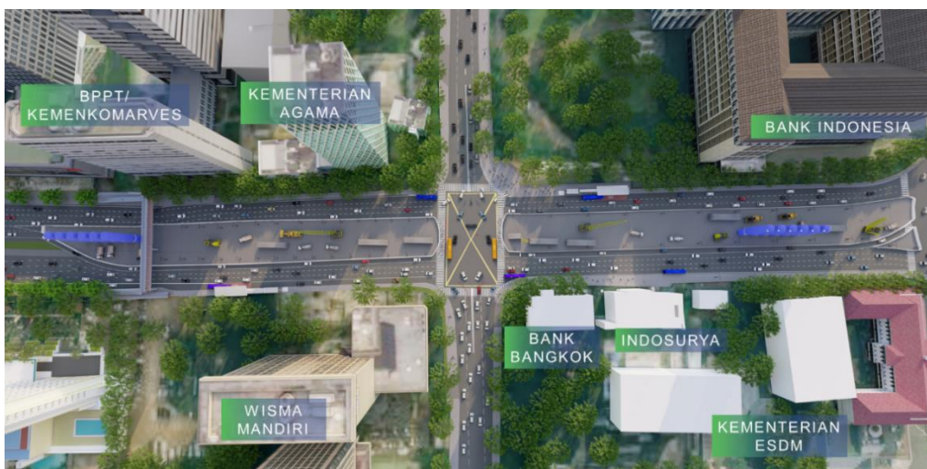
Gambar Ilustrasi Rekayasa Lalu Lintas Tahap 1-4C Periode 16 Juni 2023 hingga 31 Desember 2023